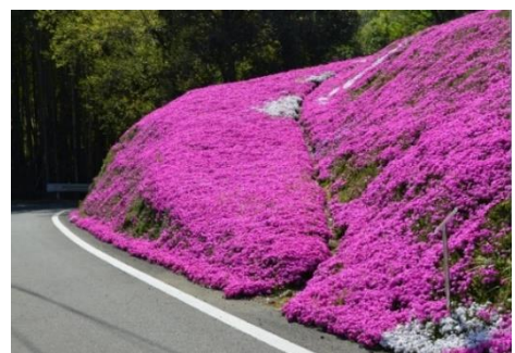
写真3 シバザクラロードの風景

シバザクラの植栽活動は、元々、平成10年頃から、地区の女性有志数人が農道の景色を通行者に楽しんでもらおうと、自宅周辺に植栽を始めたことがきっかけである。