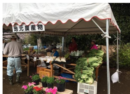
写真2 シバザクラまつりでの農産物販売