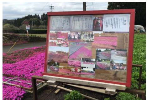
写真6 協議会の活動をまとめた看板