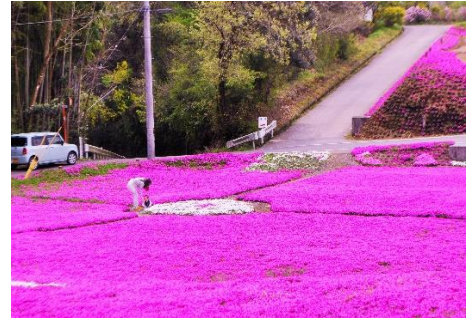
写真1 一面に植栽されたシバザクラ

自分たちの地域を何とか盛り上げていきたいという気持ちから、久木野自治会、小田元自治会の役員で話し合いを重ねた末、元々、地区の女性数人が自宅の玄関先に植栽していたシバザクラに着目。2 集落まとめてシバザクラの植栽を通して地区を PR していくという方針を打ち立て、平成 19 年に「一里山地区ふるさとづくり推進協議会」を設立した。