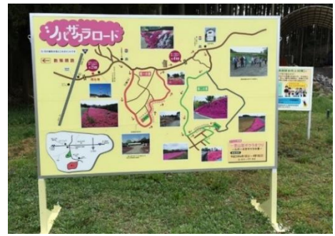
写真4 協議会作成案内看板

週間程度、「シバザクラまつり」を開催し、名産品である茶等の地元農産物を販売する物産コーナーを設置。ウォークラリー等のイベントを併せて実施した年もあり、年々盛況となっている。現在は、県外客を含め、期間中に約1万人の見物客が訪れるまでの人気イベントとなっている。