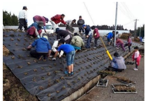
写真5 住民一丸となった景観保全活動

現在は、毎月、協議会の役員会を開催し、地区の課題や活動内容を協議している。また、定期的に農道の草刈りや水路の泥上げ作業、地区の清掃作業を実施し、年間を通して、住民一丸となり景観保全活動を行っている。