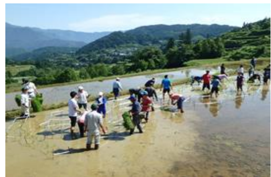
写真5 田んぼアートの田植え作業

本山町では、ブランド米のPRのため、ブランド米の生産者等で組織する本山町特産品ブランド化推進協議会が主催で平成 22 年度から田んぼアートや棚田コンサートを実施しており、平成 26 年度からは吉延の棚田を会場に田んぼアートを毎年実施している。田植えには協議会や吉延営農組合のメンバーはもちろん、高知県内の大学生や、お米の消費者、一般公募で集まった県内外の方など、多方面から幅広い層が参加しており、交流の輪が広がっている。吉延営農組合主催でも、集落内の別