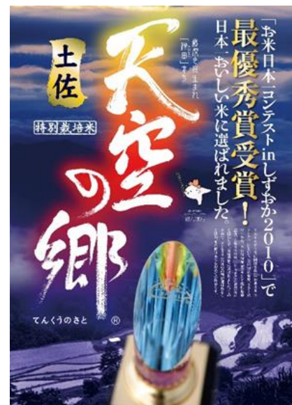
写真2 ブランド米「土佐天空の郷」

また、お米のブランド化により、「受け継がれてきた歴史ある棚田をこの先維持できるのか」「経営の出来ないこの棚田で後継者が育つのか」といった農家の悩みも打開され、後継者が将来展望の持てる稲作農業の確立に繋がっている。