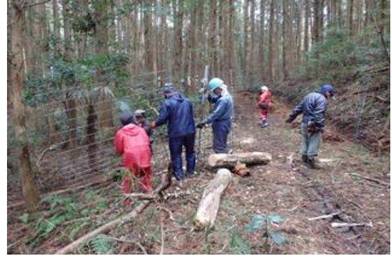
写真4 防護柵設置の様子

ブランド米の取り組みが成果を上げる一方で、イノシシによる水稲被害が増加。これを受け、吉延集落では国の鳥獣被害防止総合対策交付金を活用し、集落全体を囲うように 3.5 km の防護柵を直営施行により設置した。設置作業にかかる費用については、中山間地域等直接交付金を活用し、吉延営農組合を中心に、男性だけでなく女性も設置作業に加わり、集落一体となって鳥獣被害の防止に取り組んだ。防護柵の設置後は毎年の見回り点検や補修作業を行うなど、農家が安心して農業に取り組める環境づくりを継続しており、鳥獣被害に強い集落づくりに取り組んでいる。