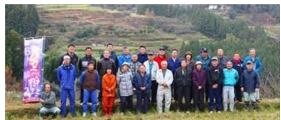
写真3 生産者の皆さん