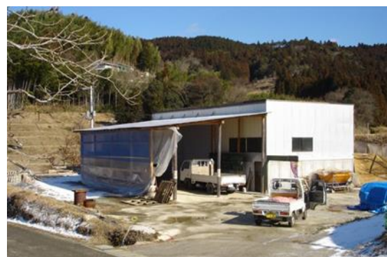
写真1 ライスセンター

また、高齢や病気などの理由で耕作や農地の維持管理が難しくなった農業者が出た場合でも、営農組合が農作業受託により農地の保全を引き続き行うという支援体制の取組を吉延集落の協定で規定してお