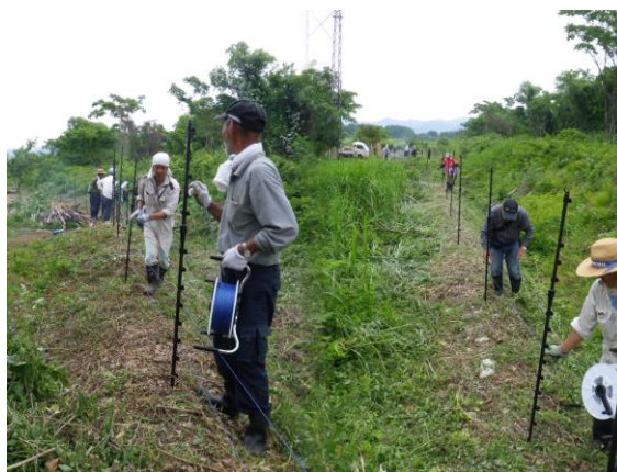
写真4 電気柵設置作業