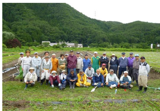
写真6 ザル菊植栽作業の参加者