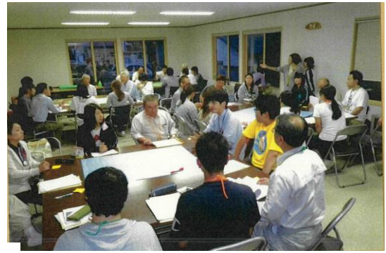
写真8 福島大学生と区民が 交流したワークショップ