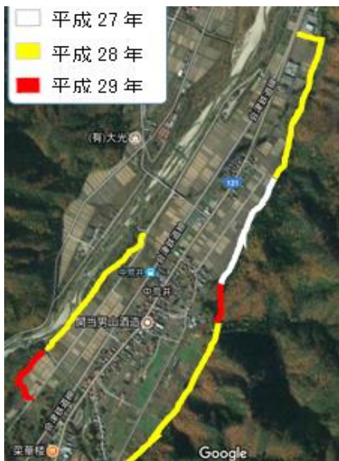
写真3 電気柵設置箇所