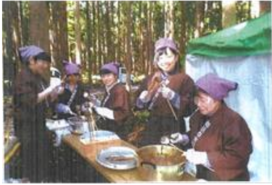
写真7 如活祭での「しんごろう」 づくりの様子