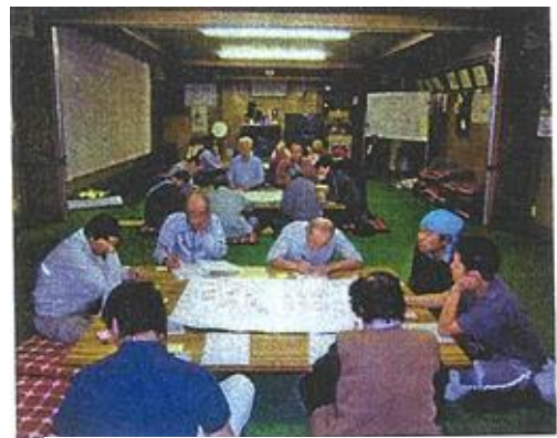
写真1 ワークショップ

一方で、中荒井区には江戸時代に禅を広め、優れた医術で人々を救ったとされる「如活 じょかつぜんじ 禅師」の墳墓・仏塔があり、かつては禅師の命日近くに供養のための墓前まつり「如活祭」が行われていた。この祭りを区の役員が中心となり、平成 21 年に区民総参加で復活させた。これをきっかけに集落内外の人たちの交流が広がり、地域づくりの機運が高まった。また、平成 26 年に「中荒井コミュニティセンター」を整備した際に「快適な中荒井集会施設づくり委員会」を組織し、区民から