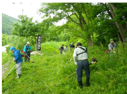
写真2 水路周辺草刈り作業

また、遊休農地の増加や優良農地の荒廃を防ぐため、刈払いや耕起の代行作業に取り組む、地域の農業法人が再生した農地を有効活用し、そばを栽培している。