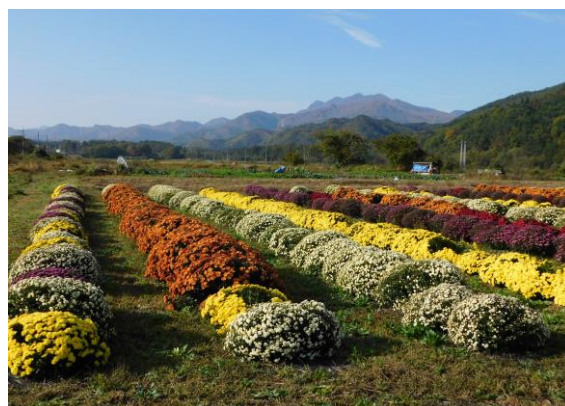
写真5 中荒井区駅沿線のザル菊

さらに、NPO法人との農福連携や森林保全のための間伐体験を行うとともに、福島大学の学生と連携して集落をPRするなど、様々な組織の協力を得ながらむらづくりに取り組んでいる。