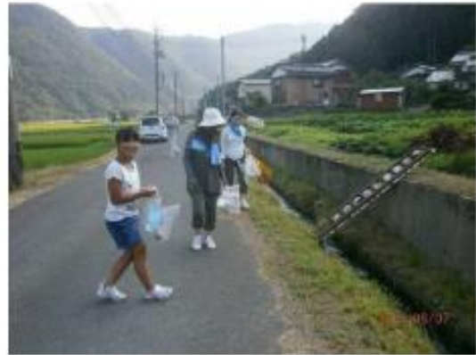
写真4 集落清掃活動

自然環境に関連する整備等は、主にボランティア組織「サイコーヒダ」が担っている。ボランティア参加への住民意識も高く、たとえば河川敷の草刈りでは毎回 20～30 名の参加がある。また、活動の幅が広く花植えやクリーン活動などの景観向上作業に加え、生態系保存活動の一環として子どもを交えた集落河川での生き物調査や交流会を行っている。住民アンケートでは住居周辺での自然環境が高く評価されており、ボランティア活動の成果と考えられる。