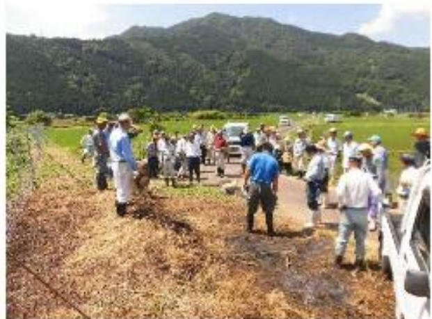
写真 2 鳥獣防護柵設置作業

平成 20 年代初頭から野生鹿の出没が増え、農業被害だけでなく住民の安全確保が課題となった。集落内で協議を重ね、平成 23 年に獣害対策の強化を図るため「日田鳥獣被害対策委員会」を設けた。これまでの活動は、電気柵より維持管理が容易で侵入防止効果が高い高さ 2 m を主とするワイヤーメッシュ柵を隣接集落とも協力し、総延長 5.4 km にわたって設置したり、箱わなにより年間 30~50 頭を捕獲し一部をジビエとして解体処理施設に持ち込んだり、村祭り（収穫祭）に提供するなどの活動を行っている。これらの成果により近年、集落内への出没や獣害が大きく減少している。