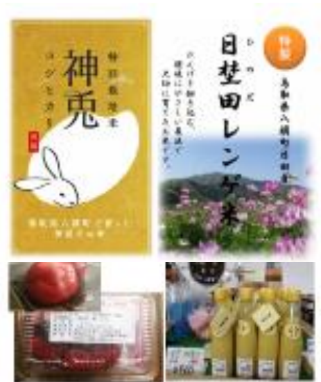
写真3 ブランド米、加工品

今後、日田集落では白ねぎの栽培規模を拡大する計画としており、調製作業場としても利用できる農業機械格納庫の整備を計画するなど白ねぎ生産の拡大を図る上で必要となる省力化、効率化に向けた施設整備に取り組んでいる。