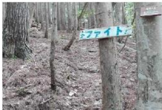
写真 5 整備した登山道（遠見山）

地域の山「遠見山（とおけんざん）」の魅力を発信することを目的に、地元日田の有志を中心に「遠見山馬酔木（あせび）の会」（会員 16 名）を結成している。この会が中心となり、登山道を整備し毎年、春と秋に登山大会（毎回地区内外から約 60 名が参加）や絵葉書の作成・配布を行い、地域の魅力発信に寄与している。