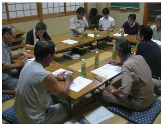
写真1 「日田を良くする会」話し合い

多面的機能支払交付金制度の実施組織として発足し、交付金の使途等について協議を重ねるうちに意図することなく集落内にある各組織（自治会、農事組合、(農)日田農業生産組合、老人会、婦人会、サイコーヒダ、鳥獣被害対策委員会、日田の明日を考える会等）の調整役を担う組織に成長した。現在、常任理事6名、各組織代表の理事5名で構成され、役員会を月1回開催している。役員会では各組織の計画や活動状況が報告され、課題等の共有と村づくり的な意見交換をする場となっており、集落活動の方向付けに大きな役割を果たしている。