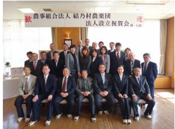
写真1 農事組合法人設立祝賀会

その後も集落の活性化について幾度に渡る話し合いを行った結果、平成20年に集落営農組織「見祢 みね 営農組合」を設立し、集落内で生産した農産物の販売、首都圏住民との交流、集落への集客に向けた新そば祭り開催などの活動を開始した。また、平成22年に集落の重要な担い手が離農することとなり、対応を協議した結果、今後もさらに離農者が見込まれ、個別農家の規模拡大による営農継承が困難になるとの判断に至り、体験農業の受入が主な活動であった「見祢営農組合」を改組し、特定農作業受委託契約を締結し耕作を行う「営農組合 ゆいのむらのうがくだん 結乃村農楽団」を平成22年2月に設立した。同営農