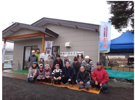
写真3 農家レストラン結

農楽団は、集落で生産した農作物の地産地消や集落への集客を目的に平成26年3月に「農家レストラン結」を開店した。レストランでは、見祢区内の団体「見祢女子会」メンバーが当番でパートとして就労するとともに、メニューを考案するなどしており、法人経営の支えとなっている。