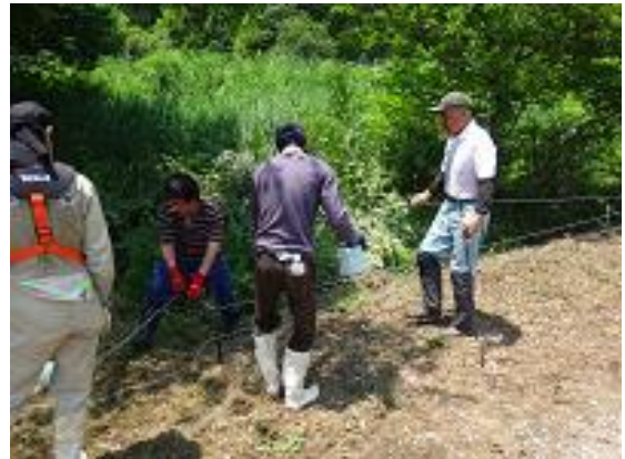
写真 4 電気柵設置作業

平成 25 年頃から、ツキノワグマによる農産物への被害や集落内への侵入が頻発するようになった。さらに、平成 28 年からはイノシシによる水田の掘り返しや畦畔破壊が多発し、集落住民の安全が脅かされるとともに、農業者の営農意欲の低下が懸念される事態となった。そこで、平成 29～30 年の 2 カ年をかけて集落周りの里山や農地周辺部に総延長