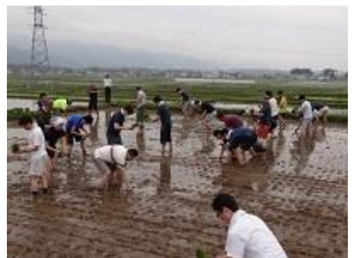
写真 5 首都圏企業の田植え体験

平成 20 年 12 月に米の販売先である横浜市栄区公田町団地の「NPO 法人お互いさまねっと公田町団地」からの依頼で、同団地の歳末福祉バザーに出店したのをきっかけに都市農村交流の取組が始まった。現在では、交流先が 8 グループ(11 団体)、2 大学に増え、様々な活動や相互訪問等を行っている。さらに、平成 29 年からは都市部のひとり親世帯の親子と集落の P T A 及び子供会との交流活動を開始し、集落の伝統行事等への参加も受け入れている。今後、集落内の空き屋対策を実施するとともに、集落内への移住者に対するサポート体制を確立し、集落