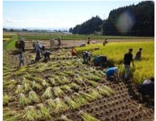
写真6 稲刈りフェスティバル

また、福島県郡山市の N P O 法人しんぐるまざあず・ふおーらむ・福島との協同取組として、平成 26 年から田んぼオーナーや田植え・稲刈りのフェスティバル、収穫祭等を行っている。