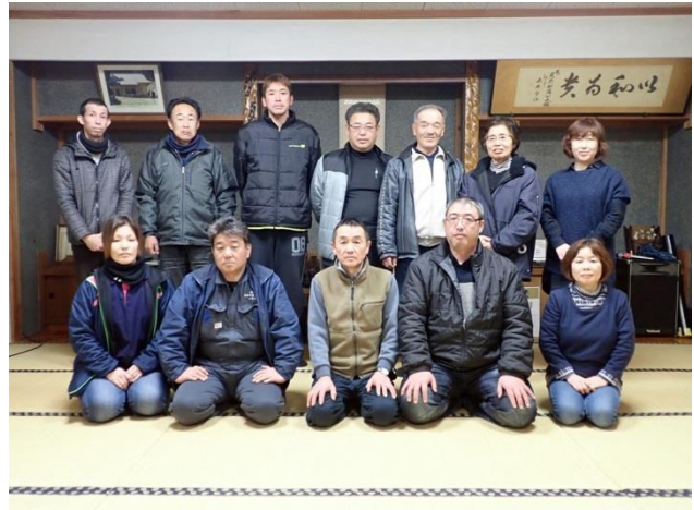
写真2 見祢結乃村未来協議会構成員

各団体が地域づくりや集落活性化、農地維持活動をそれぞれ実施している中で、各団体の連携や意思疎通を図る場が必要になり、平成29年6月に各団体が構成する「見祢結乃村未来協議会」を設立した。