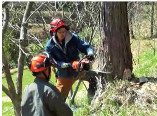
写真2 里山整備の様子

また、来訪者を迎えるため、地元木材を使った手作りの案内看板や東屋を設置したり、木のボールペンを商品開発するなど活動の幅を広げている。このボールペンは平成29年11月に開催された全国育樹祭の記念品にも採用された。