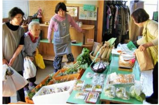
写真1 ふるさとの家販売の様子

毎週土曜にオープンする「ふるさとの家」には、五名産の新鮮な野菜や加工品・工芸品が並ぶ。品揃えも幅広く価格設定も良心的なため、地区内外から多くの買い物客が訪れている。売上金のうち9割を商品提供者へ、残り1割を運営費に充てている。また、単なる直売所ではなく、地域のPRや交流が図られる場とするため、売りに隣接して五名の風景写真を展示した喫茶スペースを設けるなど、住民たちが自らの手でリフォームした内装も魅力の一つであった。一角に設けられた食堂スペース「ふるさと茶屋 杉菜」では、イノシシカレーうどん、イノシシ餃子などのジビエメニューを提供。杉菜のオープンを契機に、遠方客や若者客の来店が増えたことで、売上げアップはもちろんのこと、地区内外の交流人口増加による賑わいづくりにもつながっていた。