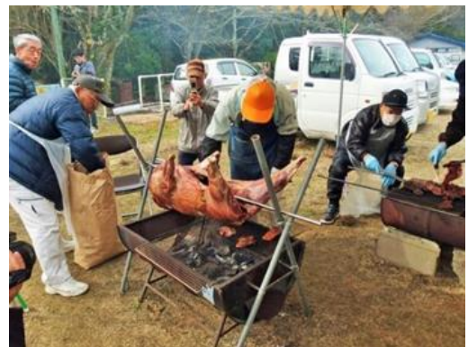
写真3 名物イノシシの丸焼き里

五名三大祭りの1つ「いのしし祭り」は、毎年12月にふるさととの家の周年記念行事として開催される。五名が誇る自然の恵みに感謝するとともに、五名ジビエを発信する当祭りでは、イノシシカレーうどんとイノシシ汁の無料ふるまい、イノシシの丸焼き、イノシシカレー、イノシシ丼、イノシシ焼きそばのほか、あめご塩焼き、山菜おこわなどのバザー販売や、新鮮野菜の直売が大人気。サックス演奏や“ししきらーず”によるマリンバ演奏、宝探し大会などのアトラクションも行われる。企画段階から香川大学の学生も参加しており、盛り上げに一役買っているところである。