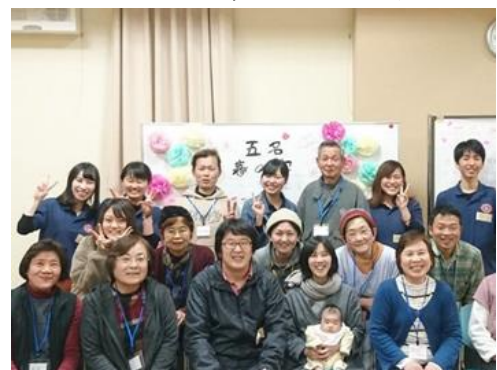
写真4 移住者を囲んで

移住者による取組みも様々。林業、陶芸づくり、家具づくり、カフェや美容室の開業、地ビール製造など、個性あふれる多様性が五名の魅力を引き立てている。