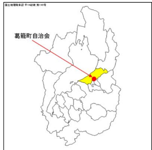
第 1 図 位置図

その間には緑豊かな水田が広がり、水稻を中心とした土地利用型の農業が営まれている。