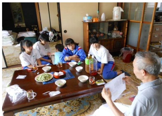
写真6 修学旅行生の受け入れ

（毎年10名程度）や地域おこし講座も積極的に受け入れ、高齢者に昔の暮らしを語ってもらうなど高齢者が活躍する場や、老若が交流できる機会を設けている。