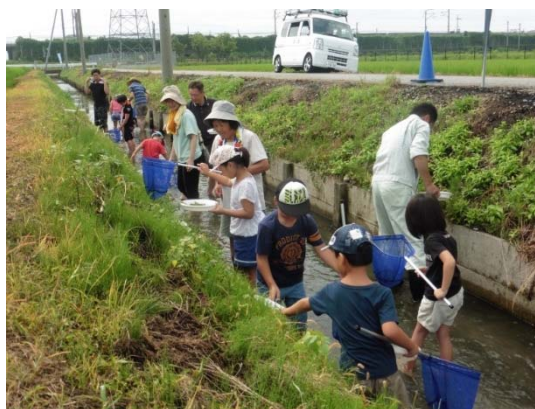
写真5 田んぼの生き物調査

子供たちを対象とした、旧中山道の松並木や史跡の清掃活動、資源回収作業に加え、平成18年からは、農地・水・環境保全向上活動組織が中心となって田んぼの生き物調査も開始し、歴史・環境教育の年間を通じて実施し、琵琶湖の環境保全も含めた自然の恵みへの感謝の心を醸成している。