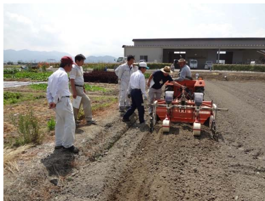
写真1 若者へのオペレーター研修

現在、30歳代に3名、40歳代に4名、50歳代に7名と次世代の人材も確保できており、スムーズな世代交代、経営継承が期待できる。