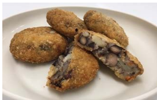
写真3 黒豆コロッケ