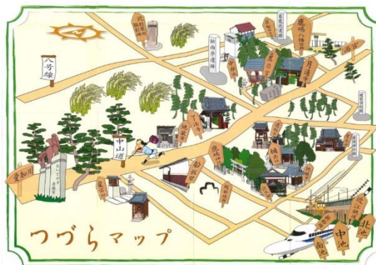
写真4 つづらマップ&ガイド

また、「松雨亭遺跡」と、明治政府の学制頒布により小玉氏家屋において開校された「博習学校跡」の石碑及びこれらを紹介する案内看板を設置し、観光客の散策に活用してもらうほか、住民の歴史文化の醸成にも寄与している。