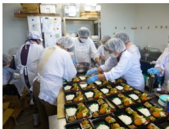
写真2 女性部による健康弁当の製造

同年10月には、農協系統の「アグリシードファンド」を活用した増資や、女性組合員の新規加入及び出資により経営基盤の強化を図り、加工所