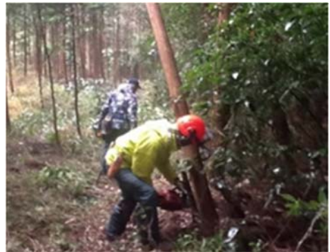
写真4 登山道の整備

久野地区から箱根に至る古道（昔の踏み跡）を開墾、道をつけ、明星登山道（奥和留沢みはらしコース）を整備し、登山道沿いには、ミツバツツジや山ツツジの植栽、案内板、駐車スペースを整備した。このことにより、多くの利用者が地域を訪れている。