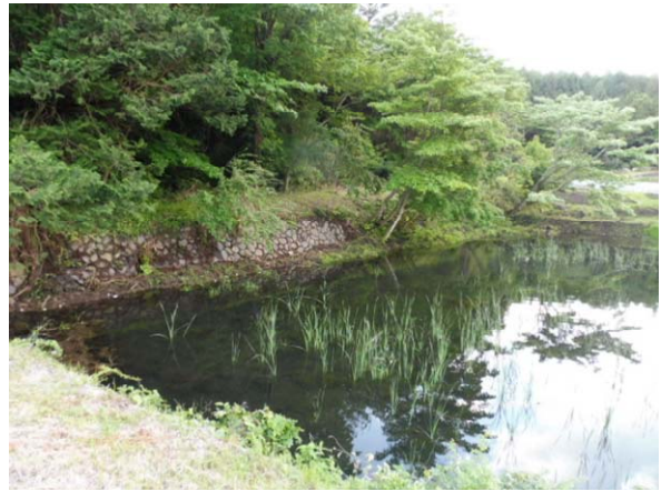
写真3 維持管理するため池

漁業面では、ブリの森づくりプロジェクト等の関係団体と連携して、山林と里山に手を入れその健全性が向上することで、魚付き林の再生に取り組んでいるほか、ヤマメの放流等も行っている。