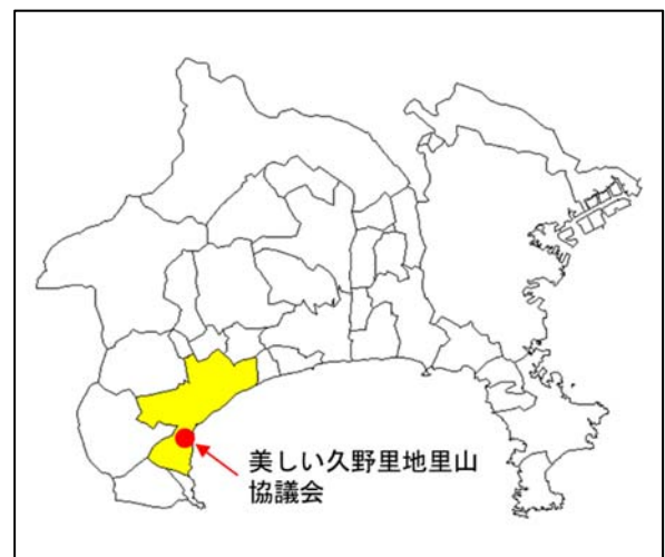
第 1 図 位置図

小田原市は、面積が 113.81 km 2 、人口が 191,958 人（平成 30 年 2 月 1 日現在）で東京からおおよそ南西に約 80km に位置する。神奈川県西部に位置し、市の南西部に箱根外輪山から延びる山地が広がり、東部は丘陵地帯となっており、中央部には酒匂川が南北に貫流し、その兩岸に足柄平野が形成されている。また、南部は相模湾に接しており、変化に富んだ地形で構成されている。戦国時代に関東一円を支配した北条氏の本拠である小田原城を中心として、市の南部では商工業が発展し、それを取り囲むように平野部では水稻や野菜、丘陵地では柑橘や梅を中心とした農業が営まれ、沿岸部では漁業が盛んである。