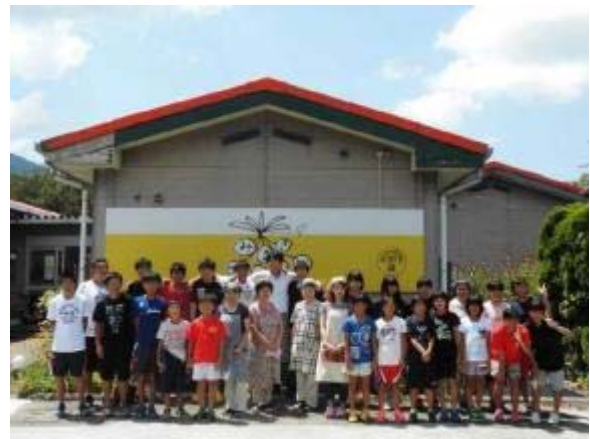
写真 4 みまきガーデン

また、いもたきや手芸づくりのワークショップ等のイベントの開催や、平成 30 年 3 月には、初めて結婚式会場として利用するなど新しい試みにもチャレンジしている。