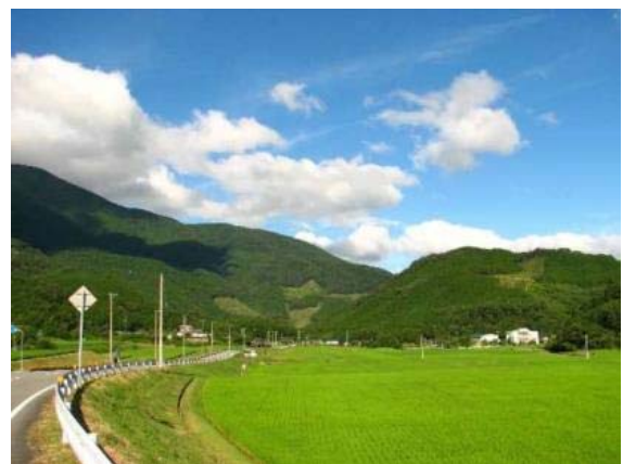
写真 1 御槇の田園風景