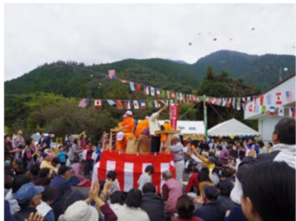
写真 3 御槇ふるさと市の様子

主催を御槇ふるさと市実行委員会に、場所を自然休養村管理センターに変更し、愛媛大学や民間企業等の協力（ボランティア）を得ながら、毎年、地域の産業イベントとして開催しており、地域や特産品 PR、消費者との交流の場として地区内外より多数の参加者が訪れている。