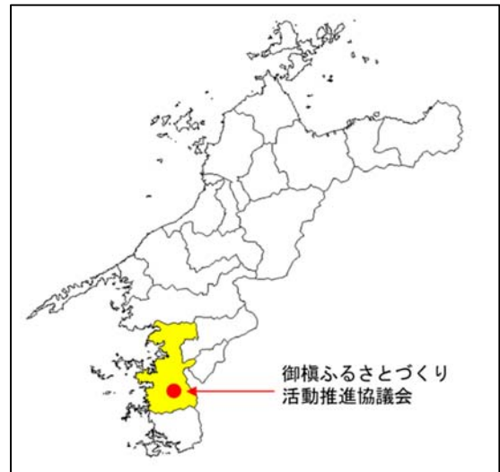
第 1 図 位置図

産業では、豊かな自然を生かした一次産業が盛んで、特に水産業は、真珠やマダイ・ハマチ養殖などは、国内でもトップシェアを誇っている。農業では旧吉田町や沿岸部を中心に、かんきつ栽培が盛んで、宇和島市の農業産出額 (H27 推計) 約 116 億円のうち果実が約 85 億円を占め、なかでもポンカンやブラッド