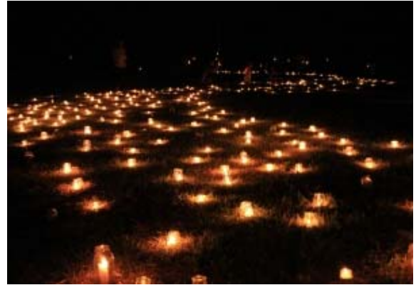
写真6 みまきキャンドルナイト

また、地域内に宿泊施設・食事提供施設ができたことにより観光客の増加の効果もあった。