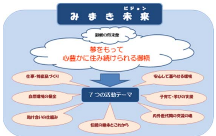
第 3 図 みまき未来 (ビジョン)

この集落づくり事業の実施により、参加した住民が御槇集落の将来を自ら考える機運が醸成され、その後の主体的な活動につながった。