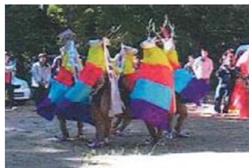
写真 5 五つ鹿踊りの様子

伝統芸能の保存を目的とした「御槇郷土芸能保存会」では、公民館と共同で、御槇集落の大きな魅力である「五つ鹿踊り」や「虫送り」「篠相撲」、「盆踊り」等、地域に伝わる伝統行事の保存・継承活動に努めている。