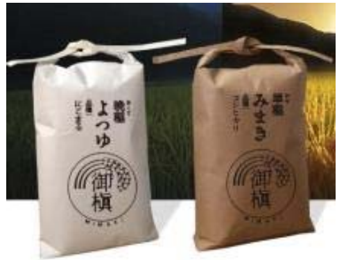
写真 2 「御槇米」ブランド

平成 24 年 2 月に地域の農業者で「御槇米生産協議会（以下「生産協議会」という。）」を設立し、PR チラシの作成、HP の開設等の活動を展開し、ブランド力向上・販売促進に努めている。宇和島市のふるさと納税の返礼品にも選定され、販売量や知名度は徐々に向上しており、集落の基幹品目である米の振興を栽培面だけでなく販売面からも後押ししている。