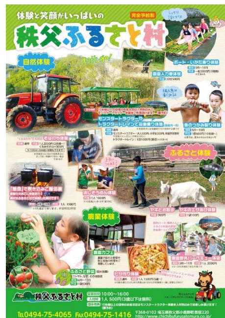
写真1 秩父ふるさと村

平成4年に、協議会が主体となり地域内に「般若の丘直売所」を開設し、運営を行っている。