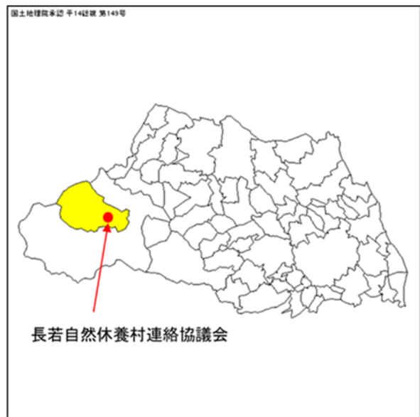
第 1 表 地区の概要