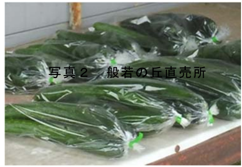
写真2 般若の丘直売所

小鹿野町では、町の特産であるきゅうりの生産振興を図っていくため、きゅうり施設を継続して利用し、後継者を育成することを目的に「小鹿野町明日の農業担い手育成塾」を平成25年に立ち上げ、農業への新規参入に力を入れている。特にきゅうり生産者の協議会員が、これら新規就農者（後継者）の技術指導を行い、継続した農業の担い手育成を行