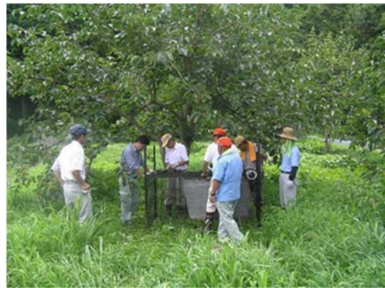
写真7 捕獲用檻の設置

地域で問題になっている野生鳥獣被害対策のために、協議会員を中心とした「長若地区鳥獣害対策協議会」を組織した。緊急雇用対策事業を活用した遊休農地の雑木の伐採、除草を行うことによる野生動物の出没軽減対策や、最近急増しているニホンジカやイノシシ、サルの捕獲及び行動解析など、連携して行っている。