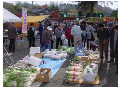
写真4 長若自然休養村まつり