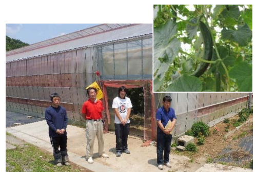
写真5 きゅうり施設と新規就農者