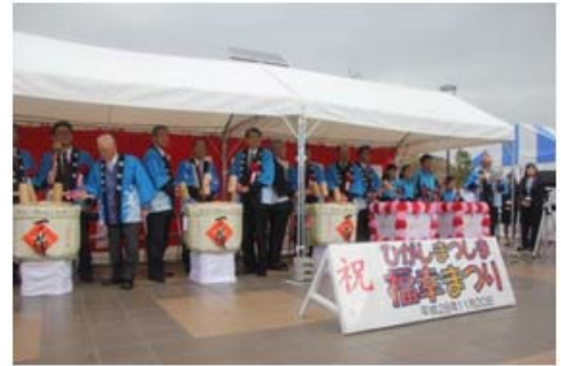
写真4 福幸まつり (H28)

のびる多面的機能自治会と同会構成員の有限会社アグリードなるせは、震災で自宅を失い地元を離れ、仮設住宅で暮らす大勢の人たちに「年に1回は地元に帰って、復興の様子を見てほしい。自分の農地を見てほしい。」と呼びかけ、平成24・25年は有限会社アグリードなるせが主催、平成26・27年は、のびる多面的機能自治会が主催となり「福幸祭」を開催している。平成28年は、集団移転地の土地引き渡しにより、東松島市が主催し、「ひがしまつしま福幸まつり」として開催された。宮野森(旧野蒜)小学校児童の太鼓演奏を始め、地場産品の無料試食、地域住民との交流を深めるイベント、地域農産物の販売などが催され、地域住民は、もちろんのこと、仮設住宅に住んでいる方や、ボランティアの方々、ふるさと野蒜の復興を願う方々など1万5千人余りの方が集い、更なる復興を願いつつ、有意義な交流イベントが実現できた。