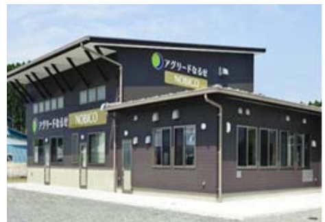
写真 2 農産物処理加工施設「NOBICO」

被災移転跡地で生産した大豆（品種：あきみやび）を活用し、菓匠三全・JR 東日本と開発した「仙台きなこシリーズ」は、仙台駅構内で販売されている。また、地ビールの原料である大麦栽培は復興事業推進を支え、地域の復興や発展に広く貢献している。