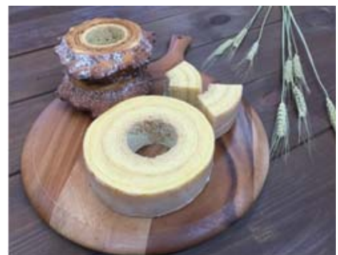
写真 3 のびるバウム