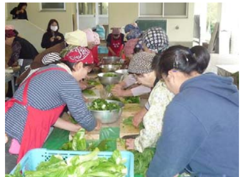
写真 8 加工部門での女性の活躍

なお、協議会構成員 42 名のうち、女性は 13 名であり、約 30% を占めるほか、直売・加工部会においては、その占める割合は更に高くなっている（直売部約 80%、加工部約 70%）。