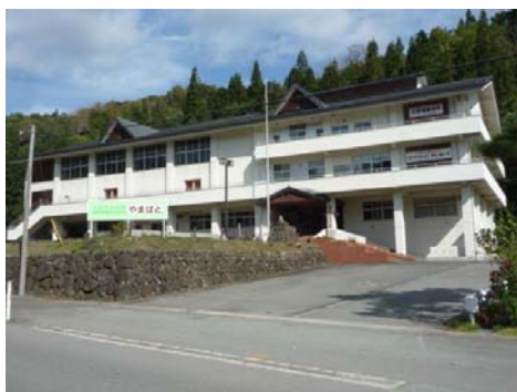
写真1 やまばと外観

平成19年、小学校跡地の活用を検討する組織を立ち上げ、地域活性化に向けた検討を開始、平成20年に旧山ノ内小学校校舎を宿泊・体験型の「山の内自然体験交流施設やまばと」として整備したことにより、地域の気運が一気に高まった。