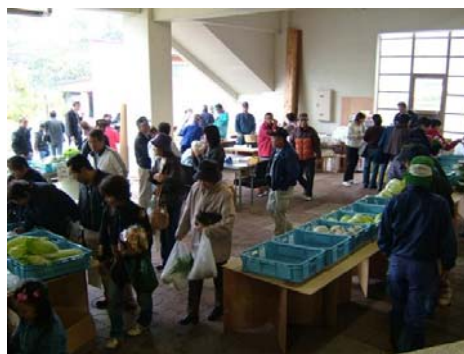
写真2 産直施設販売状況

施設開設と合わせて産直施設をオープンし、5月下旬～11月下旬の週末営業を行い、山菜やきのこ、高冷地野菜を販売しており、また、平成24年度には、山形県森のめぐみ王国やまがた支援事業の補助を受けて加工施設の整備を行い、年間を通じた農林産物の加工・販売が可能になった。これらのことにより、県内外からのファンを集め、交流拡大や農業振興、経済活性化に寄与する結果となっている。