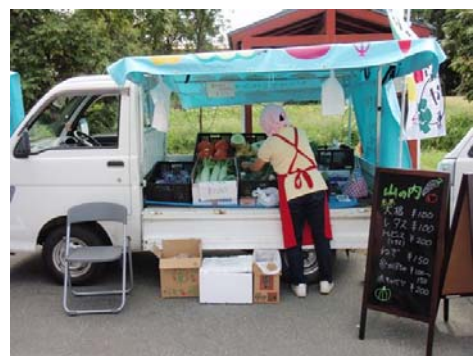
写真3 からほろマルシェ

加工施設においては、各家庭に受け継がれている漬物や郷土料理を発掘するために「おらが自慢の漬物大集合」等のイベントを企画しながら、商品化し年間を通じて加工販売している。特に冬期間の収益につながっている。