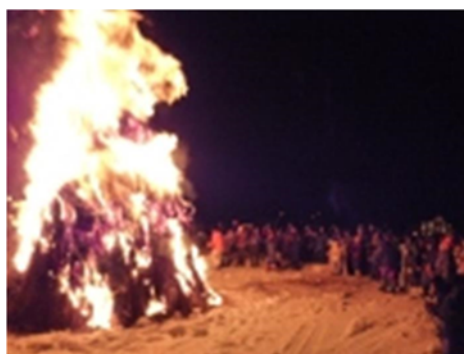
写真7 大おさいとう