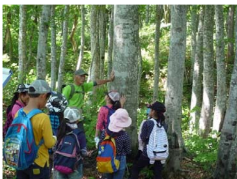
写真6 ブナ林トレッキング

都市住民等を対象にした教育旅行受入れ事業や交流イベント事業等を実施し、年間約7,000人が来訪している。