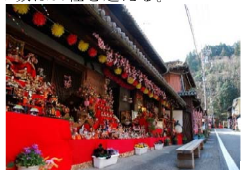
写真6 坂本おひな街道

また、町内のNPOが中心となり開催する日本最大級のひな祭りイベント「阿波勝浦ビッグひな祭り」に合わせ、町内外の人々が参画するひな祭りイベント「おひな様の奥座敷」（平成14年～）、「坂本おひな街道」（平成18年～）を開催し、町内への集客と町のイメージアップに貢献している。