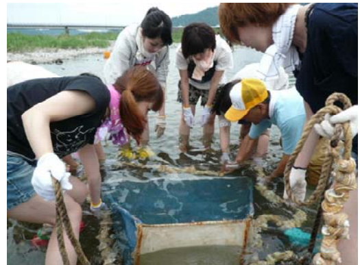
写真4 じんぞく狩り

これらは、単なる「農村体験」ではなく、「人と人とのふれあい」を目的としており、地元で「達人」と呼ばれている人たちがインストラクターとなり、体験や食文化の発信に留まらず、昔日の思い出話などを交えて対応している。食品加工等の体験では、「女性ならではの感性」による家庭的な雰囲気を出している。