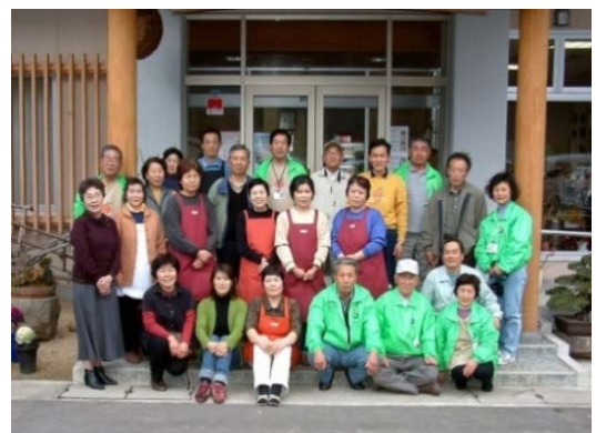
写真2 運営委員会のメンバー及びふれあいの里さかもとのスタッフ

また、こうした経費は、参加料等や「ふれあいの里さかもと」での収益の活用、勝浦町からの事業補助等により賄っている。