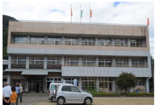
写真1 廃校となった坂本小学校

明治7年に創設された「坂本小学校」は、約120年間、1地域1小学校として、集落の中心施設を担ってきたが、過疎化、少子化に伴う児童数の減少により、「複式学級による存続」または「隣接校へ統合」の選択を迫られ、苦渋の選択により、平成11年3月、隣接校へ統合となった。