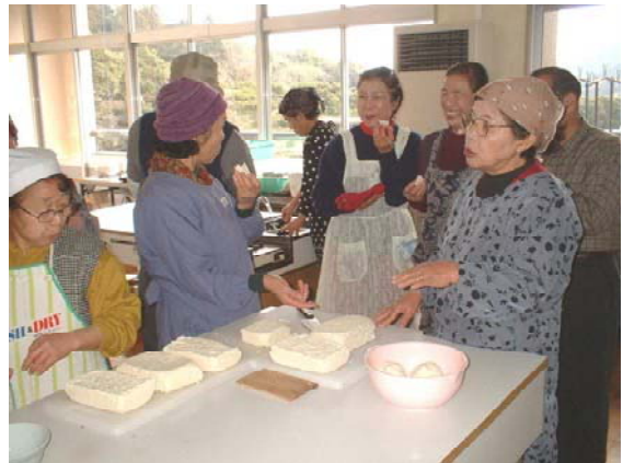
写真3 女性の活躍(田舎豆腐作り)

また、主要産業である「温州みかん栽培」の担い手を育成する農業振興の取組に加え、定住促進対策などの活動も行っている。こうした取組が契機となり、勝浦町内外でのまちづくりや地域活性化の取組に波及しており、さらなる地域づくりの拡大が期待されている。