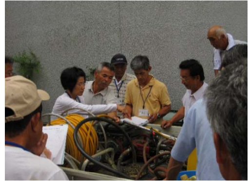
写真5 坂本農楽・みかん組

「坂本農楽・みかん組」は、栽培指導のベテランを講師に迎え、座学と園地での実地指導による年間を通じた実践的な講座であり、毎年20人余りの受講がある。新規就農者やみかん栽培の学び直しをする者を支援しており、平成27年度までの9年間で延べ200人が修了し、平成28年度も24人が受講するなど、農業の担い手育成の一端を担っており、農業の担い手のレベルアップや仲間作りの場として好評を得ている。