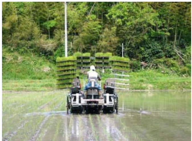
写真3 大規模稲作農家（作業の様子）

現在把握している移住世帯31戸の内、農業に携わる世帯は20戸にのぼり、安全な環境で安心できる農産物を家族に食べさせたい、という動機などから自然に寄り添う暮らし方を体現している。こういった趣旨から各戸の栽培面積は3aから50a程度と小規模だが、中でも本格的な農業を志す2戸ではそれぞれ6