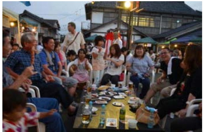
写真2 イベント活動（ビアガーデン）

志賀郷の取り組みは、「移住・定住対策」と「6次産業化」の2つの取り組みが相乗効果を発揮して地域活性化に繋がっている事例である。有志による「複式学級化の阻止」という明確なスローガンのもと、「小学生以下を持つ家族」という、対象を絞り込み、移住・定住につなげており、移住者の定着率は8割