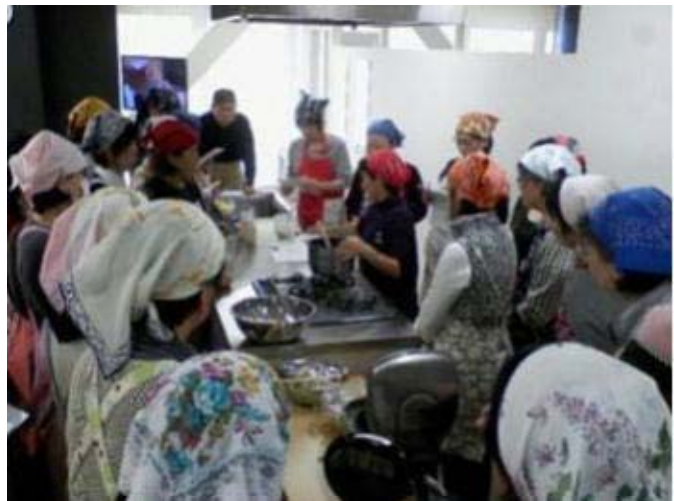
写真6 麴の料理教室の様子

また、加工センターでは適切な衛生管理のもと、女性が農産加工に従事できる体制を整備し、自分たちの作った加工品を店頭で販売すること等によって、消費者との接点が生まれたことで、女性の社会参画に対する意識は大きく高まっている。