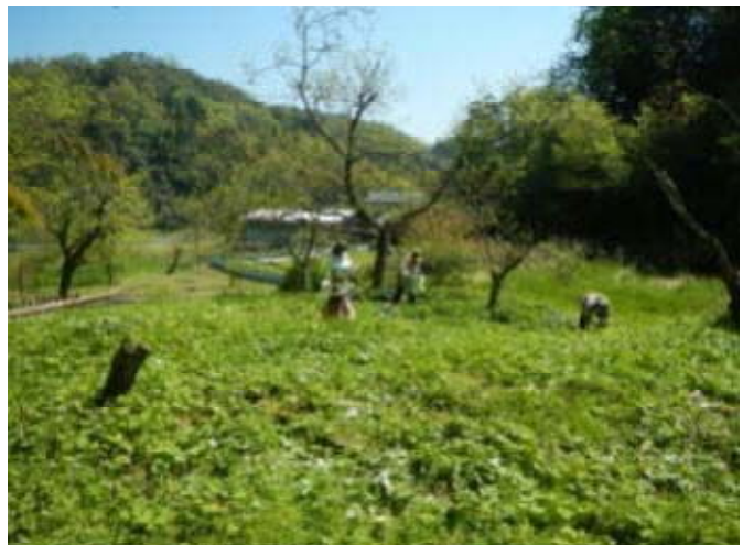
写真5 山裾の農地で栽培される山ブキ

「塩こうじ」、「甘酒」、「味噌」などの米関連製品を主力としている。また、地域特産物である万願寺とうがらしを使用した佃煮や味噌などを開発製造し、原料を提供する生産者にとっては市場流通できない規格外品の有効利用が図れることから経営安定に繋がると喜ばれている。また、春の味覚として製造している「山ブキの佃煮」の原料は、山ブキが中山間地で日当たりの悪い条件で栽培しやすいことから、遊休農地解消対策として栽培された山ブキを仕入れることで地域農業の維持に貢献している。商品の販売は、中丹3市（綾部市、舞鶴市、福知山市）にあるJA直売所や綾部市内ではホテルや温泉、市が運営する「あやべ特産館」などで販売している。また、京都生協と連携した中丹支部企画として年2回の組合員向け販売も定着しており、一般生菌数検査結果の提出など厳しい衛生基準が求められる販売先との取引を良い刺激として日頃の衛生管理に努めている。