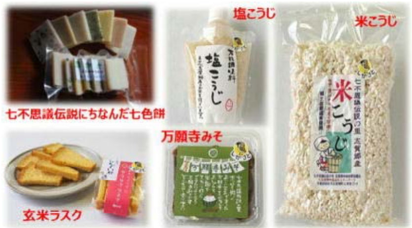
写真4 地域の農産物を活用した加工品

加工センターでは、原材料をできるだけ地元から仕入れることに努めており、地域の主産物である米の活用を図るため、「米粉シフォンケーキ」や「米こうじ」、さらには米こうじを活用した