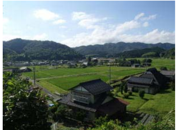
写真1 志賀郷の風景

本地域は「山に良材、里に人材」という村是のとおり、基幹産業である農林業の振興と人材育成に取り組んできたが、昭和30年の町村合併や昭和30年代からの高度経済成長などの影響を受け、昭和25年度に3,801人だった人口は減少の一途をたどり、平成17年度には1,455人にまで減少した。また、小・中学校においても児童・生徒の減少は例外ではな