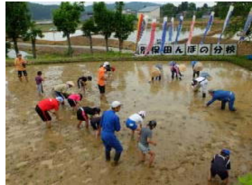
写真1 別俣田んぼの分校 (田植え)

当地区では、農村地域に住みながらも、子ども達が農業や自然に触れる機会が少なくなっていることに気づいた当時の別俣小学校のPTAが中心となり、地域の農業者等の協力を得て、平成12年に「別俣田んぼの分校」の取組を開始した。これは、将来、子ども達が成長した時に、“ふるさとを誇りに思うことができる地域づくり”を目指して取り組み始めたのものであった。