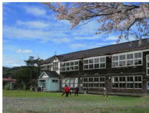
写真2 旧別俣小学校

持つ木造校舎を守ることが、“子ども達にふるさとを残すことにつながる”という信念の下、校舎の存続に向け住民の合意形成を進めてきた。その結果、校舎を計画的に利活用を図ることを条件に柏崎市から校舎を譲り受けることとなった。