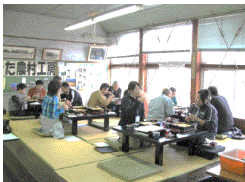
写真4 ふるさと食堂「喜楽来」

存続となった木造校舎については、体験交流活動の拠点として有効活用を図ることから、平成23年に校舎内に農家レストラン「ふるさと食堂『喜楽来』」を開設し、地元産の新鮮な野菜や山菜を用いた郷土料理を提供している。ここでは、昔懐かしい木造校舎で味わう地元のお母さん達の手づくり料理が人気を呼び、平成27年ではオープン時の約2倍となる約1,900人が利用している。