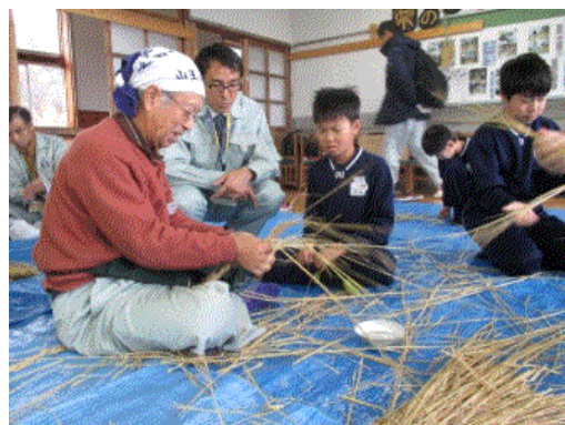
写真3 高齢者によるわら細工づくりの実演

特に、技術と知恵の玉手箱である高齢者、バイタリティにあふれる女性達は、活動の縁の下の力持ちであり、