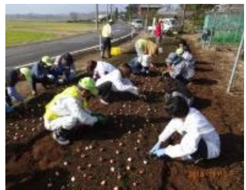
写真7 植栽活動による景観形成