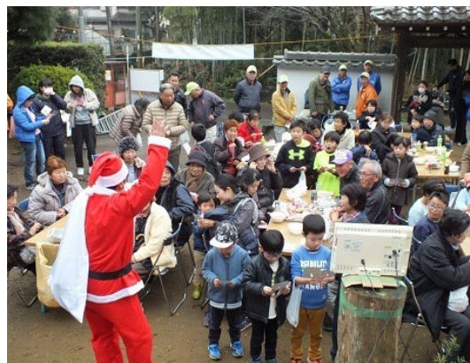
写真 9 年末開催の「ワイワイ感謝祭」

特に「ワイワイ感謝祭」は、地域の賑わいを目的に集う場として、平成 30 年より年末に開催しており、小学校区域の近隣地域の子供たち同士のつながりが新たな来場者の増加に繋がっており、子どもにも参加できるイベント開催などにも力を入れている。令和 6 年は 96 名来場、うち地域外からは 26 名の来場となっている。