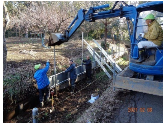
写真5 水路の補修の様子

豪雨や浸水発生の際などには農家以外も力を合わせて漂着ゴミを拾うなど、耕作可能な状態に維持するため皆で行動し地域農業の安定生産に寄与している。