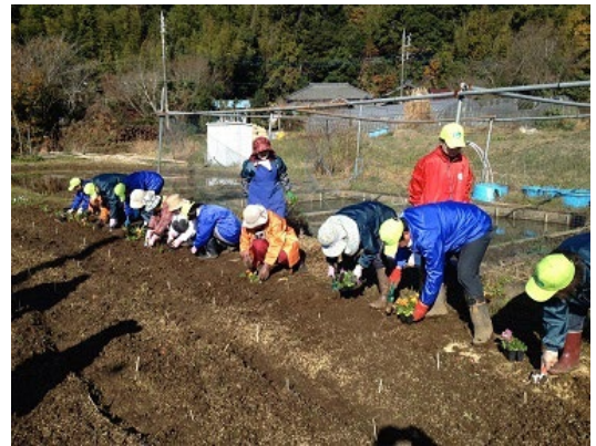
写真2 農道沿いの植栽作業