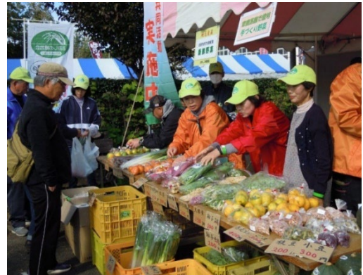
写真6 佐倉・産業大博覧会での販売の様子

このような独自活動にも、多くの女性が参加し、地域全体で協力しあって各活動が充実している。