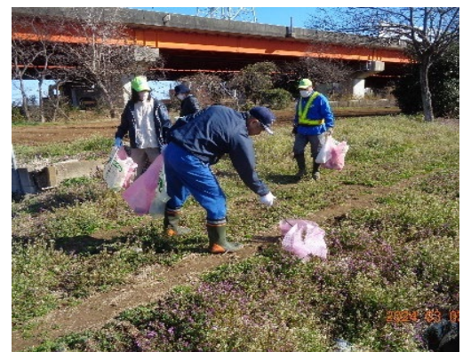
写真8 クリーン活動 (農道等のゴミ拾い)

多様な独自活動を展開したことで、住民にとって地域の帰属意識が向上し、一体感が生まれ、これらの取組により、地域の全住民が、農業維持を目指して活動している当地区に暮らすことで感じる一体感や心の豊かさ、住みよさ、地域の価値が見直されてきている。