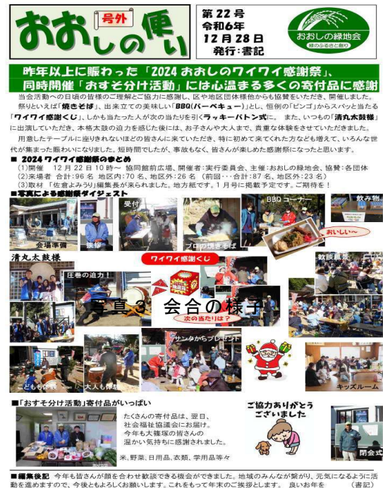
写真3 「おおしの緑地会」発行の広報誌

これら全ての活動は、毎年5月や随時発行する号外等の広報誌「おおしの便り」の発行、また総会での活動報告を通じて、非農家である地域住民にも共有すると共に、地域外の住民には、地方紙で年末の活動を毎年記事に取り上げていただくことで活動PRにも繋がっている。