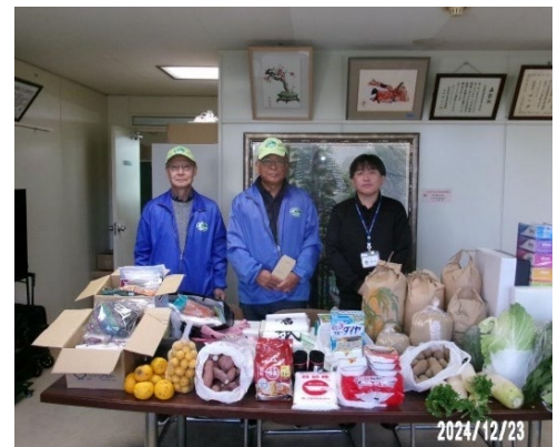
写真4 おすそ分け活動の様子 （社会福祉協議会にて）