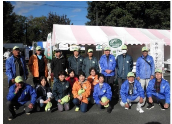
写真1 佐倉・産業大博覧会参加の構成員

また、非農家の方々にも広く活動に参加いただけるよう、地域の皆が参加可能な活動として農道の草刈りや花の植栽活動など地域の皆を巻き込んだ各種の独自活動を展開している。