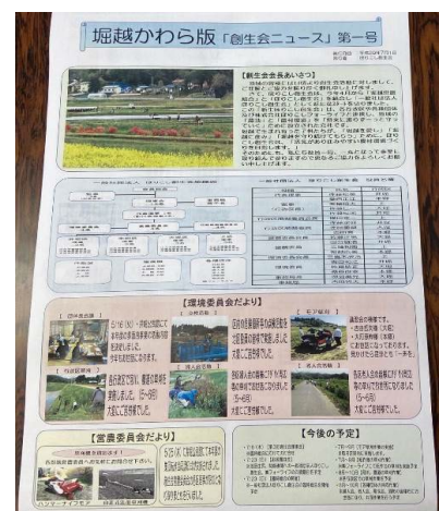
写真 6 堀越かわら版第一号