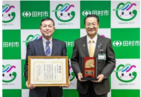
写真 4 田村市への受賞報告

ほりこし創生会全会員に対し、年に 3 回程度「堀越かわら版」を発行し、ほりこし創生会の活動内容を発信している。令和 5 年度においては、5 月に総会報告や農機具貸出しのお知らせ、農作業の安全啓蒙、10 月に米販売に関するお知らせや水路の修復情報、1 月に新年挨拶などを掲載した。地域全体で活動状況を共有し、住民一人一人が組織の一員である自覚を持つことにつながっている。