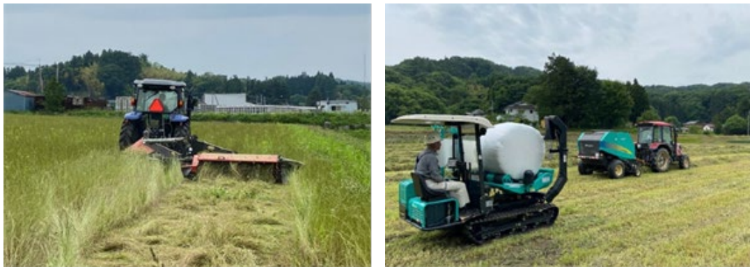
写真 3 牧草集草作業の様子