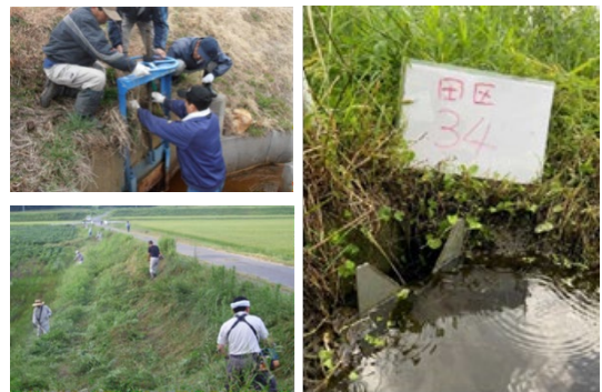
写真 5 環境保全活動と