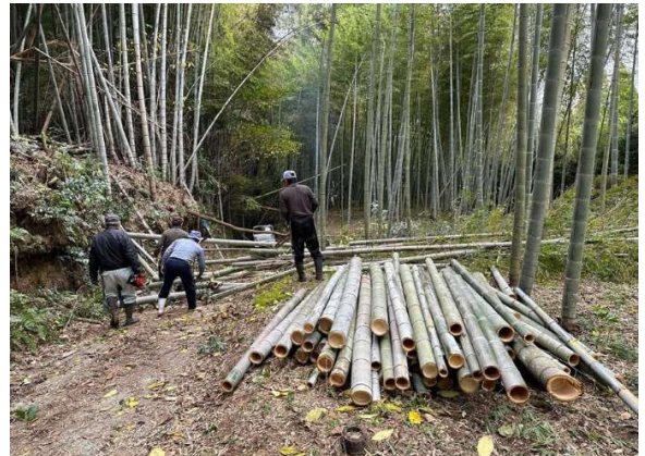
写真1 竹林整備の様子

竹子地区コミュニティ協議会は、地域の人口減少や高齢化等の課題の深刻化に伴う地域活力の低下を新たな視点で解決するため、明治後期に創設された自治組織である「竹子共正会」（現在は公益財団法人）の有志により設立された組織である。竹林整備、特産加工品の開発、「ふれあいサロンたかぜバル」の設置、移住体験施設「さるくーる竹子」の開設、都市部のアンテナショップ「じゃっど☆ラボ」の開設など、ビジョンや話し合い活動に基づいた取り組みにより、地域農業の振興、交流人口・関係人口の拡大を通じた地域活性化を進めている。