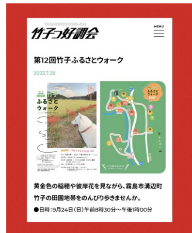
写真9 ふるさとウォーク案内

「竹子ふるさとウォーク」は例年9月に開催されており、地区内に広がる田園地帯で黄金色の稲穂と真っ赤な彼岸花が美しいコラボレーションを楽しめるイベントとなっている。美味しい霧島茶をはじめ地元の食材を使ったおもてなしが人気で、毎年200名近くが参加している。