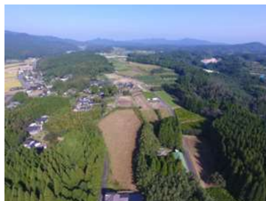
写真3 竹子原の台地

また、担い手農家のうち、4人が「竹子っ好調会」のメンバーとして活動しており、令和4年度から、竹子の新たな特産品づくりの一つとして、担い手農家と連携し、梨とぶどうのミックスワインの製造、実証を行っている。食用の梨、ぶどう数種類を組み合わせ500mlに対し約0.6kgの果実を贅沢に使用している。初年度に手掛けた450本は、クラウドファンディングを利用した販売を行い、完売となった。規格外品などやむなく廃棄される農産物を活用した、竹子の特産品となるワインができたことでその流れが広がり、個人でもワインを作ってみようといった動きも出始め、6次産業化の促進にもつながっている。