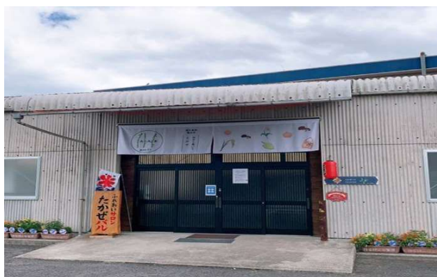
写真7 「ふれあいサロン たかぜバル」の外観

なかでも郷土菓子（ふくれ菓子、あくまき）を使用したオリジナル菓子「灰！HIGH！！たかぜ」は、県外のホテル、大手スーパーに採用され販売が行われている。