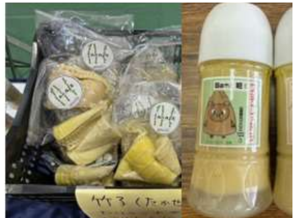
写真2 筍の水煮、ドレッシング