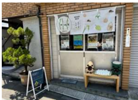
写真5 「じゃっど☆ラボ」

23㎡ほどの店舗だが、竹子直送の野菜、果物、加工品を販売しているほか、農産物を使った総菜、弁当、菓子なども販売しており、鹿児島県出身者は