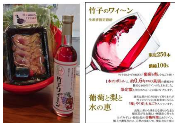
写真4 梨とぶどうのミックスワイン