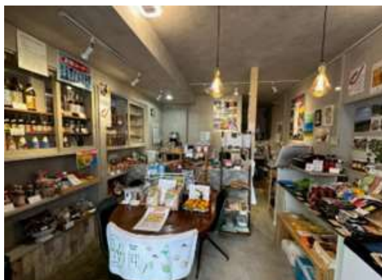
写真6 「じゃっど☆ラボ」の店内

もとより大田区地元民をはじめ、関東圏からも多く来店し、コミュニティサロンとしても賑わいをみせている。この取組をきっかけに、「じゃっど☆ラボ」は、霧島市全体を巻き込んだアンテナショップとして、令和7年5月にリニューアルオープンしている。