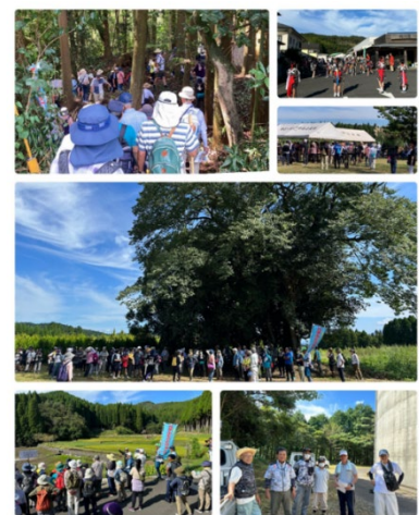
写真10 ふるさとウォークの様子