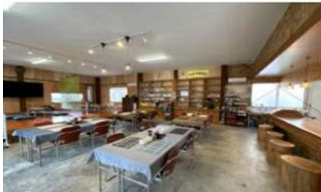
写真8 「ふれあいサロン たかぜバル」の内部