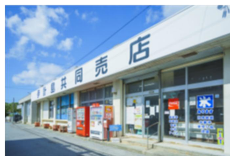
写真4 伊計島共同売店