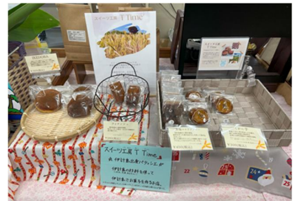
写真8 お菓子 (いけどら、くがに芋)

「サーターアンダギー」や「くがに芋(商品名)」などの加工品を女性従業員で製造を担っており、共同売店を中心に女性の参画社会も進みつつある。