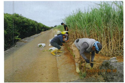
写真6 グリーンベルト植付

伊計島では、伊計ビーチや大泊ビーチをはじめとした手つかずの白い砂浜に多くの観光客が訪れているが、農地からの赤土流出により、海上汚染や生態系への影響が危惧されている。畑からの赤土流出を防止するため、うるま市上原地区資源保全の会広域協定の活動として、グリーンベルトの植栽を行っている。