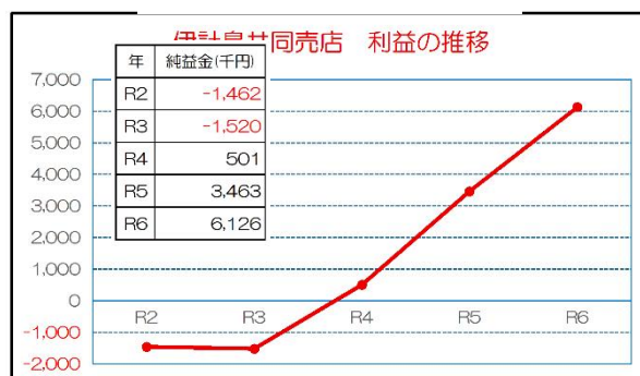
第3図 伊計島共同売店 利益の推移

自治会が管理している麦畑では、移住者と地元の交流を目的に麦踏み体験や収穫体験を行っている。体験には子ども会も参加し、伝統文化の継承や後継者の育成に取り組んでいる。これらの取り組みは、近隣の島や他地域にも優良事例として波及している。