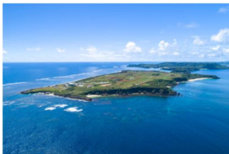
写真 1 伊計島

島の産業は主に農業と漁業で成り立っており、農家の数は 26 戸、漁業経営体数は 11 経営体で、農業での主要作物は、さとうきび、かんしょ、葉たばこであるが、最近では村おこしの契機として麦を栽培している。