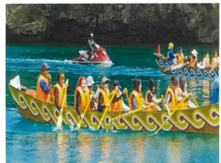
写真7 ハーリー体験

閉校した小中学校の跡地利用として、通信制高校の誘致を行い、毎年30回程度のスクーリングで約200名の生徒を概ね隔週で受け入れている。自治会や区民協力のもと、ハーリー体験などの文化教育、農業体験による地元との交流に取り組んでいる。