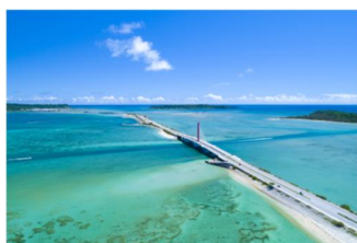
写真 2 海中道路