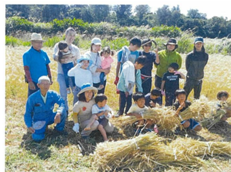
写真5 小麦の収穫体験