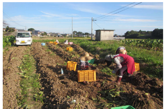
写真2 女性による里芋の収穫

本法人は、平成 18 年度に集落営農法人設立、経営規模の拡大、次世代への将来構想の策定、水田畑地化への挑戦等、数多くのステップを踏んで、農地の利用率向上と地域の農地を守る仕組みづくりを行ってきた。法人の基本理念である「地域内の農業者が作れなくなったすべての農地を法人が引き受ける。」のもと、池ノ内地区からの耕作依頼はすべて受け入れている。そのことにより法人設立時当初は、経営面積は 3 ha であったが、令和 2 年度には、約 28ha に拡大している。これは、集落の水田 35ha の約 85% が法人に集積されたことになる。また、池ノ内地区の中心経営体として、「人・農地プラン」にも位置づけられ、集落には欠かせない存在となっている。