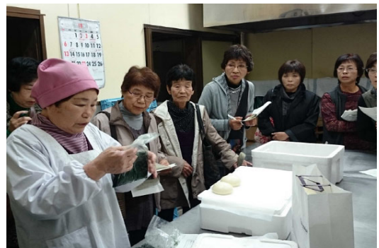
写真4 視察研修の様子

また、国東市集落営農法人連絡協議会の取組である、祈願米の生産にも参画している。祈願米は、「知恵の文殊」で知られる同市の文殊仙寺 もんじゅせんじ で、諸願成就や合格の護摩だき祈願をし、販売している米であり、本法人では、令和2年度から祈願米の指定品種である「つや姫」6haの作付けを開始した。令和3年度からは、「つや姫」の付加価値を高めるため、農産物検査で1等に格付けられ、かつ有機栽培米または、特別栽培米のうちタンパク質含有率6.5%以下であるものという厳しい基準をクリアした世界農業遺産米の生産にも挑戦している。