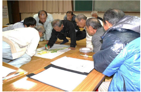
写真3 地域農業デザイン会議の様子

池ノ内地域では、農業者の高齢化や担い手不足により、耕作放棄地の増加が危惧されていた。また、法人への農地の集積が進むにつれ排水不良、用水路の破損、ほ場が小さく作業効率の悪い農地が経営農地にしめる割合が増えていったことから、このままでは次世代へと繋いでいくことが難しい状況にあった。これらの問題を解決し、池ノ内地域の次世代への将来構想を実現するため、平成24年9月に「池ノ内地域農業デザイン会議」を設立している。この会議は、法人役員、国東市、県東部振興局、地元の区長や議員、農業委員で構成され、今後の地域農業のあり方や推進方法、基盤整備について検討を行っている。その結果、平成27年度より基盤整備事業によるほ場の大区画化、パイプライン化、シートパイプの敷設など、農業の省力化、効率化により、次世代への将来構想が実現している。また、利用権設定については、ほぼ100%農地中間管理機構を活用している。