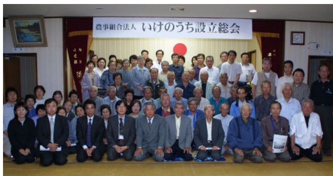
写真 1 農事組合法人いけのうち設立総会

池ノ内地域の農地は、両子山を中心に、放射状に伸びた谷からなる中山間地域であり、山間部になるほど、耕作条件が悪くなる。農業者の高齢化、担い手不足により耕作放棄地の増加が危惧されている地域でもある。そこで、中山間直接支払の話し合い