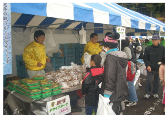
写真4 販売促進活動風景

また、令和2年産より、新たな取組として、関市内1店舗を含む県内大型量販店5店舗への販売を開始した。