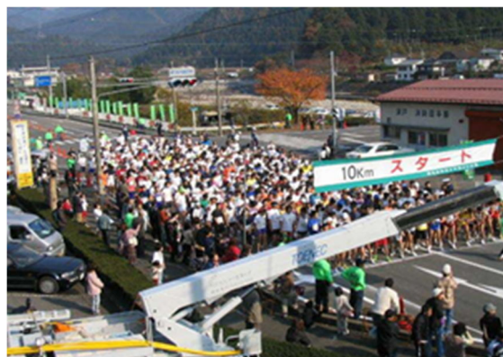
写真6 ほらどキウイマラソン風景

県内外から2千人を超えるランナーが参加し、1位から3位の入賞者と9位（キウイ）には「キウイ賞」が、また参加賞としてキウイフルーツの配付やイメージキャラクター（キウイ坊や）の活用など、ほらどキウイの知名度を向上させる貴重な機会となっている。