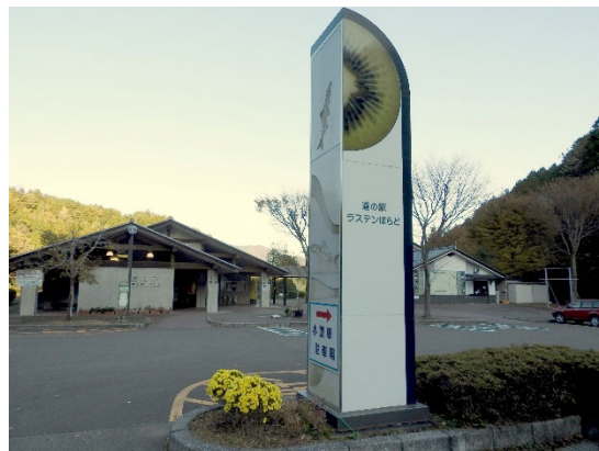
写真7 道の駅のモニュメント