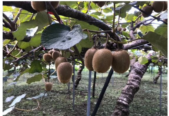
写真1 洞戸地区のキウイフルーツ

その後、めぐみの農業協同組合に合併したことから、現在の当該組織の名称も「めぐみの農業協同組合 ほらどキウイフルーツ生産部会」となっ