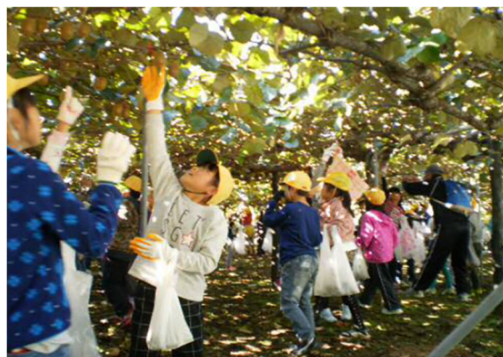
写真5 小学生収穫体験の様子

当該組織では、これらの地域農業を勉強する取組の支援を行い、将来の担い手育成やほらどキウイのファン育成に積極的に取り組んでいる。