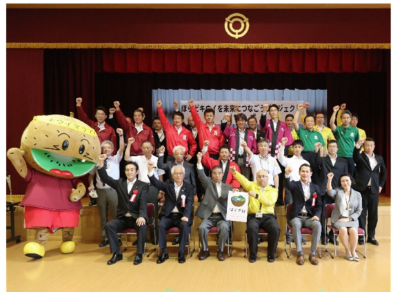
写真 3 「ほらプロ」出陣式の様子

令和 3 年度から、J A めぐみのと全国共済農業協同組合連合会岐阜県本部は「ほらどキウイを未来に繋ごうプロジェクト」(通称：ほらプロ)として、新規就農や規模拡大する際の 100a 分の棚の設置費用を支援するとともに、苗代 500 本分もクラウドファンディングで調達し、10 年後の出荷量を 20t 増加させる計画に取り組んでいる。