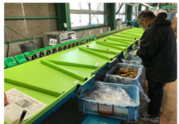
写真2 整備した選果機