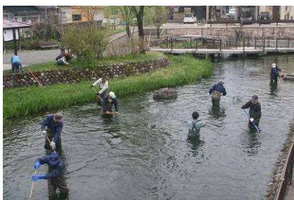
湧水地の保全活動