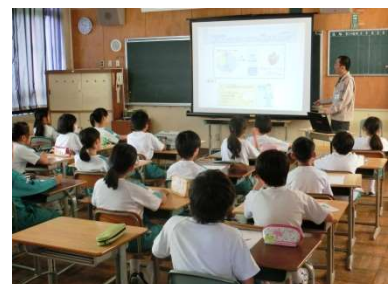
地下水保全に関する学習会