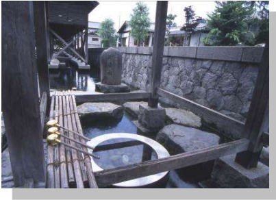
おしょうず 湧水地「御清水」 (名水百選に選ばれている)

古くから城下町として栄えてきた大野盆地は湧水、地下水が豊富。地下水は、今日でも、飲料用、農業用など様々な用途に利用されている。