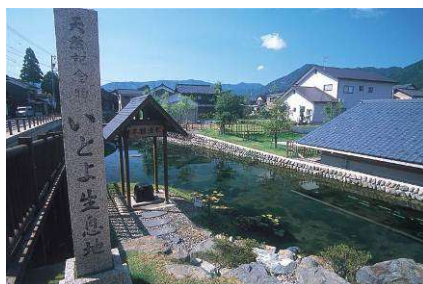
イトヨの生息地「本願清水」