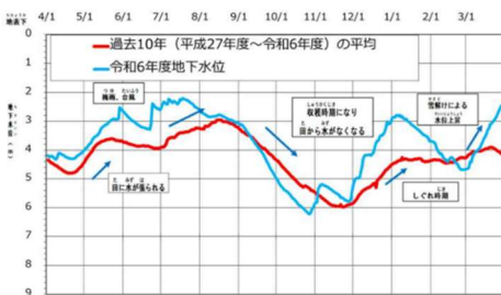
地下水位はかんがい期に上昇