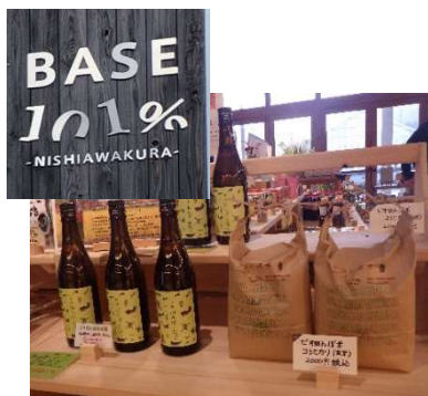
BASE101%で販売されている バイオ田んぼ米と日本酒

西粟倉村の地域資源活用と関係人口増加を目的とし、加工販売所やレストランを併設した複合施設「BASE101%」を開設し、村内産の食材を中心とした料理の提供の他、地元農産物やジビエ・木材加工品の販売を行っている。