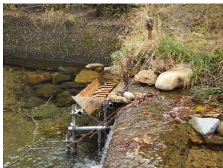
設置されたポータブル魚道