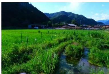
バイオ田んぼの様子