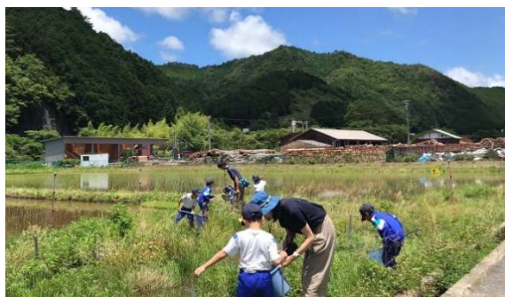
生きもの探しの様子