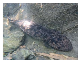
オオサンショウウオ