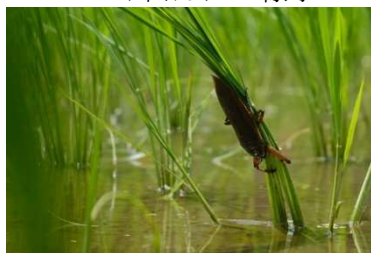
水田に生息するタガメ

同社は、2015年に西粟倉村雇用対策協議会から、移住・企業支援事業、木材・加工流通事業を引き継ぐ会社としてスタート。