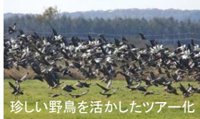
珍しい野鳥を活かしたツアー化