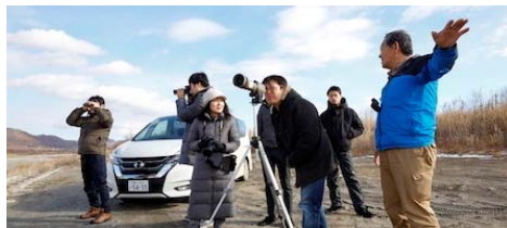
絶滅危惧種を観察するバードウォッチングガイドツアー