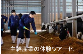
主幹産業の体験ツアー化