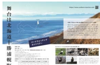
野鳥専門雑誌に掲載した広告記事