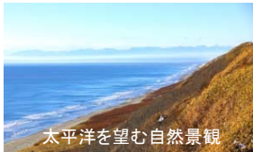
太平洋を望む自然景観