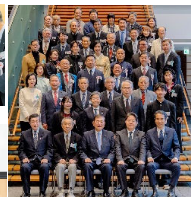
内閣総理大臣、内閣官房長官等と選定地区代表者で全体記念撮影 (交流会: 令和7年1月7日)