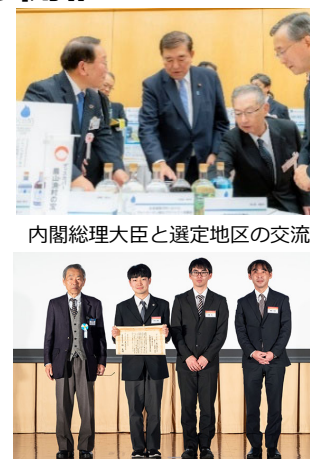
内閣総理大臣と選定地区の交流