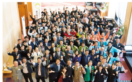
三田共用会議所において全体記念撮影 (選定証授与式: 令和6年12月17日)