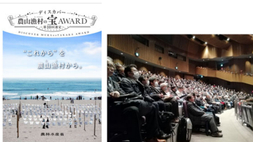
事例集発行や地域イベントの開催