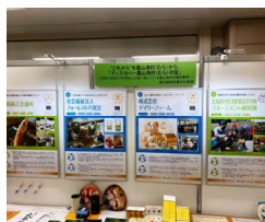
各種イベントにてPR