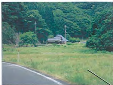
県道中三河佐用線