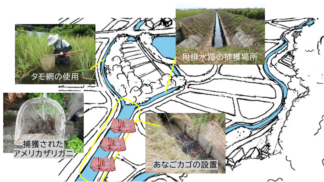
図 3-4 用排水路・水田における駆除のイメージ