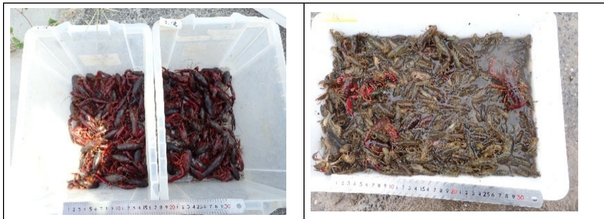
図 3-5 実証調査において大量に捕獲されたアメリカザリガニの様子(愛知県安城市)

図 3-5 に、実証調査においてため池や用排水路で大量に捕獲されたアメリカザリガニの様子を示します。場所や時期に応じた適切な方法で駆除を行うことができれば、以下のようにアメリカザリガニを大量に捕獲することも可能となります。