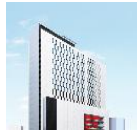
愛知県産業労働センター （ウインクあいち）

愛知県産業労働センター（ウインクあいち）18階 名古屋市中村区名駅四丁目4-38