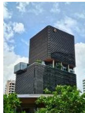
バンコク産業情報センター