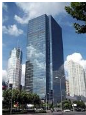
上海産業情報センター