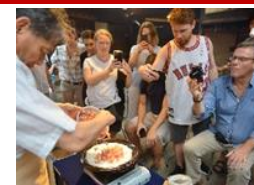
食体験コンテンツの造成