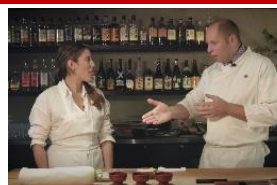
日本産食材に関する情報発信