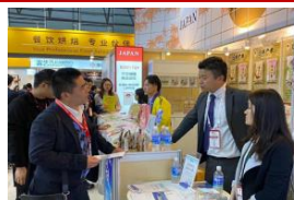
海外バイヤーとの商談