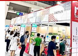
海外見本市への出展