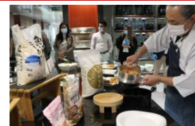
炊飯実演によるプロモーション