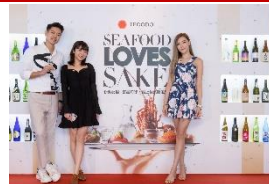
メディア関係者等を対象としたPRイベント