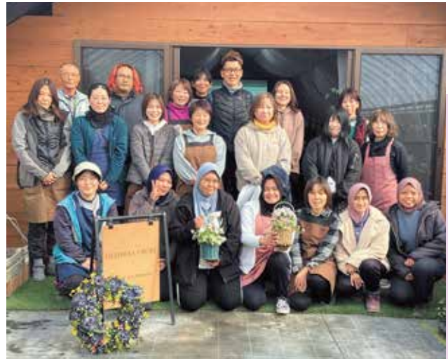
株式会社ジョージア園芸