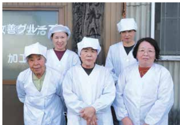
川島町生活改善グループ連絡協議会

昭和55年、川島町で始まった女性たちの生活改善の取り組み。その活動は、やがて規格外ニンニクを生かした「焼き肉のタレ」づくりへと発展した。40年以上にわたり、味を変えずに守り続けている。