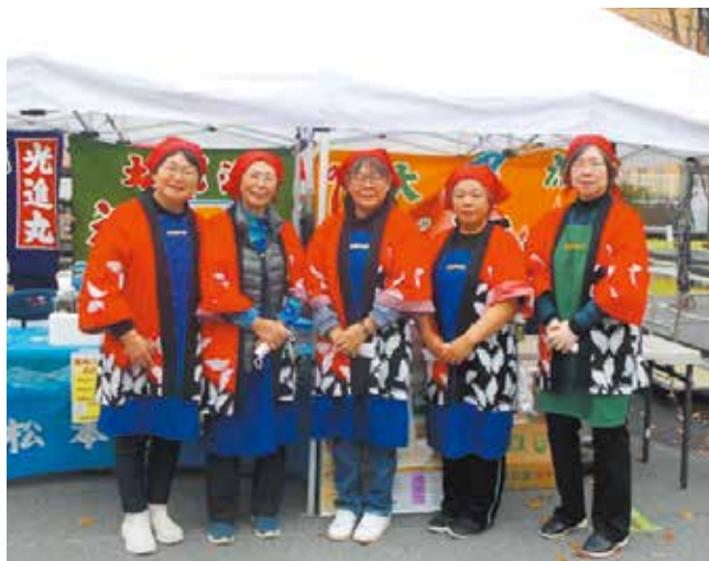
釜石湾漁業協同組合白浜浦女性部