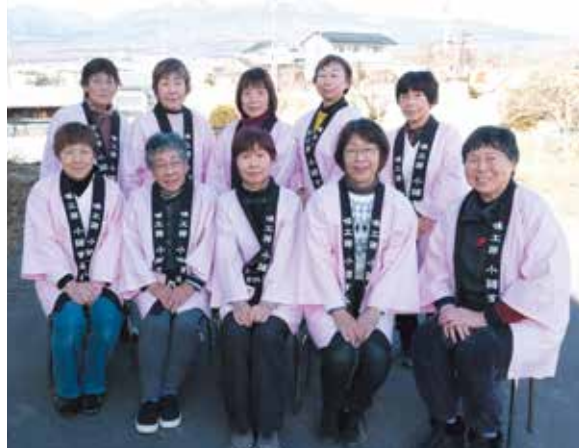
味工房小諸すみれ

平成24年頃から、小学校や保育園で豆腐づくりや味噌づくり教室を実施。子どもたちが栽培、収穫した大豆を使うことで、食と