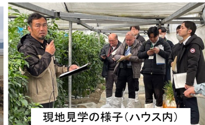
現地見学の様子(ハウス内)