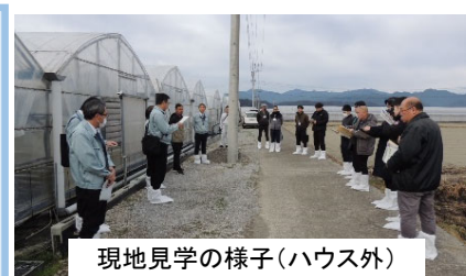
現地見学の様子(ハウス外)