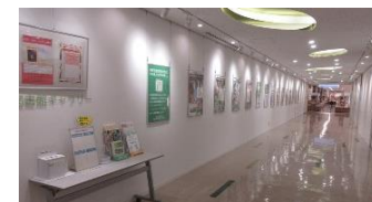
パネル展(左:とくしまマルシェ 右:徳島市立図書館)