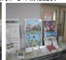
広島矯正管区との連携