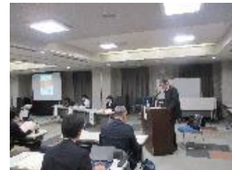
農政局からの情報提供