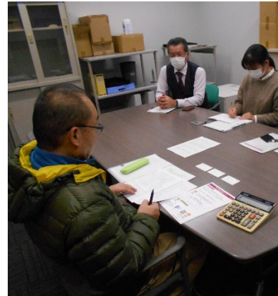
準備金申請時の意見交換の様子