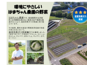
当拠点職員が作成したポップ