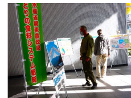
庁舎入口パネル展示