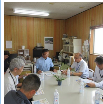
花き農家との意見交換

今後とも、地域課題の解決の一助として関係者間の連携を深められるよう、活動してまいりたい。また、引き続き事業所と連携し、地域における定期的な意見交換を実施し、多面的な地域課題の把握を行うとともに、営農を検討する情報の提示に貢献したい。