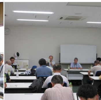
地域の農業者との意見交換