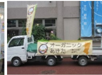
オーガニックフェスタ inあきた2025