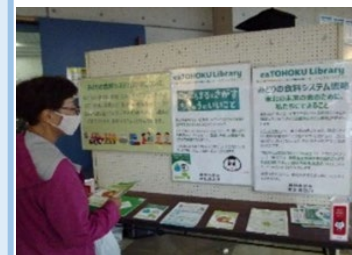
美郷フェスタの展示