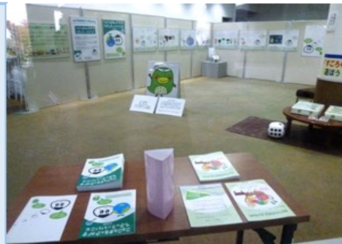
一般来場者に向けたパネル・スゴロク展示状況

・令和8年度は、展示要請があった幼稚園・小学校の団体利用や親子連れの来館者が多い秋田県立農業科学館において、7/11から8/30まで展示を行う予定であり、有機農産物に対する意識などのアンケートの実施を計画している。