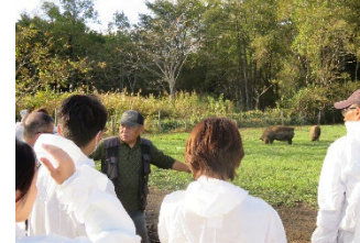
規格外農産物を給餌して養豚を行う生産者との意見交換