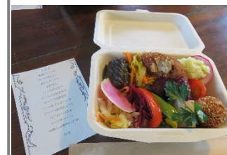
有機野菜をふんだんに使った昼食用のお弁当