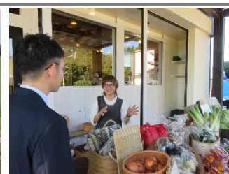
有機野菜の直売について意見交換