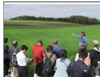
緑肥の効果について説明する生産者