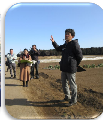
農福連携の作業現場