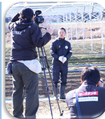
営農型太陽光発電施設

当拠点と報道関係者との関係強化、また国民への農業の理解醸成を図っていく上でも、内容の充実と改善を図りながら来年度以降も継続的に実施していきたい。