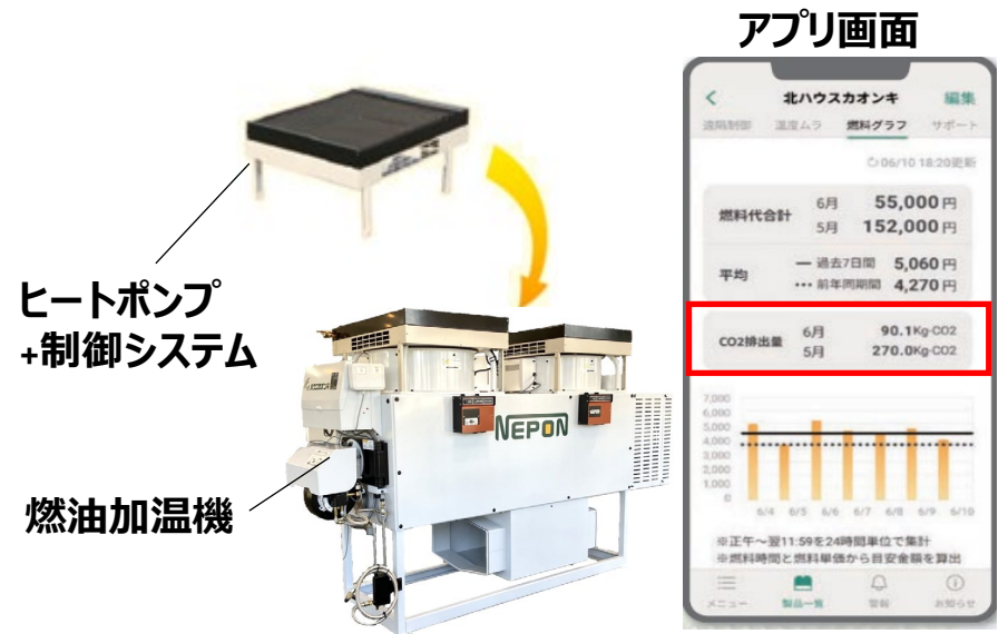
■ハイブリッド暖房方式 運転例