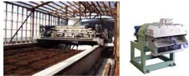
良質な堆肥の生産設備・ペレタイザー