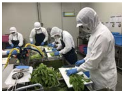
有機農産物等の冷凍加工