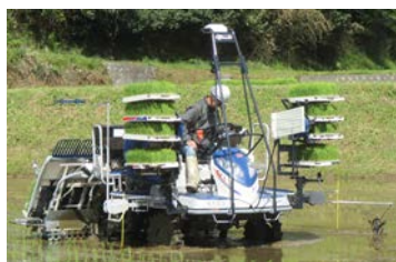
化学肥料の施肥量を減少させる土壌センサ付可変施肥田植機