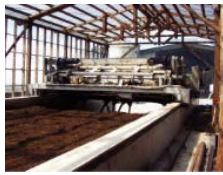
メタン排出を抑制する堆肥の自動攪拌装置

必要な設備投資に対して、既存の制度資金に加えて、無利子の「農業改良資金」、「林業・木材産業改善資金」、「沿岸漁業改善資金」の償還期間の延長の特例措置等が受けられます。