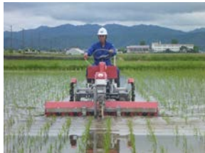
高能率水田用除草機