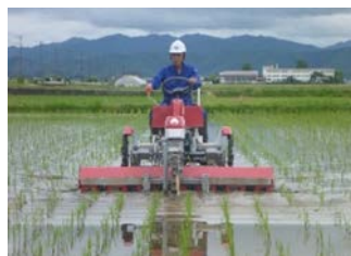
省力的な有機栽培を可能とする高効率水田用除草機