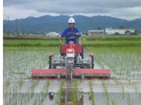
高能率水田用除草機