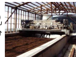
良質な堆肥を供給する堆肥化処理施設等