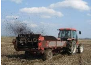
堆肥散布機 (マニユアスプレッダ)