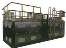
食品残渣を堆肥化するバイオコンポスター