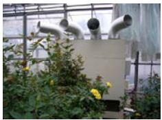
施設園芸用ヒートポンプ