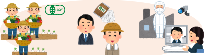
有機JAS認証取得の促進、事業者の負担軽減