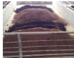
お茶殻（堆肥と混合）