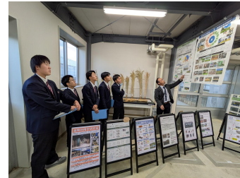
広域視察研修 （酪農学園大学）