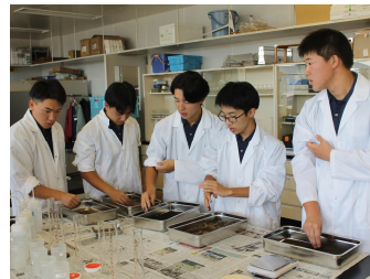
土壌診断実習 （農業改良普及センター）