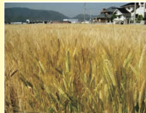
二条大麦(ビール麦)