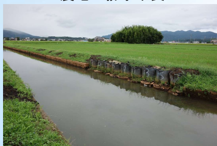
老朽化した幹線排水路