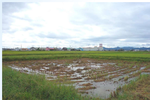
狭小な区画(排水不良田)

また、低平地であることから常に地下水位が高く、降雨時には湛水するなど水田畑利用に支障を来しており、農業者の耕作意欲の低下が懸念されています。