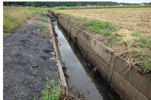
老朽化した排水路