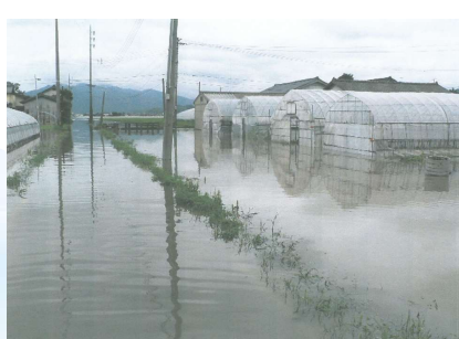
湛水被害状況(H18年7月豪雨)