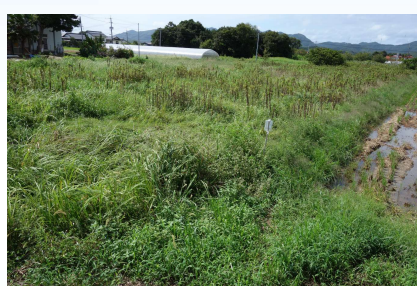
地区内の耕作放棄地