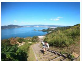
トレイルランコース