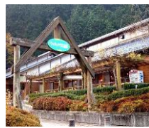
宿泊 (ウッディハウス加茂)