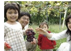
ニューピオーネ狩り