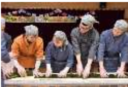
インバウンド受入 ジャンボ巻き寿司体験