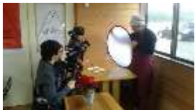
農家レストランのプレオープンをテレビ局が取材