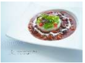
農家レストランで提供されるあとう和牛のビーフシチュー