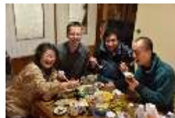
インバウンド受入 農家での団らん