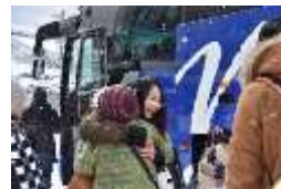
インバウンド受入 別れの時